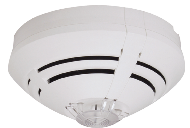
Détecteur adressable IQ8Quad

La sensibilité du détecteur OTBlue est beaucoup plus élevée que les détecteurs traditionnels du marché, ce qui permet ainsi une précocité de détection exceptionnelle tout en étant totalement écologique puisqu'il n'utilise aucune source ionisante.